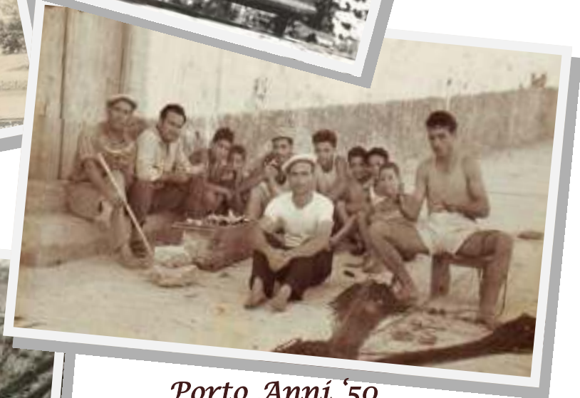
Porto Anni '50