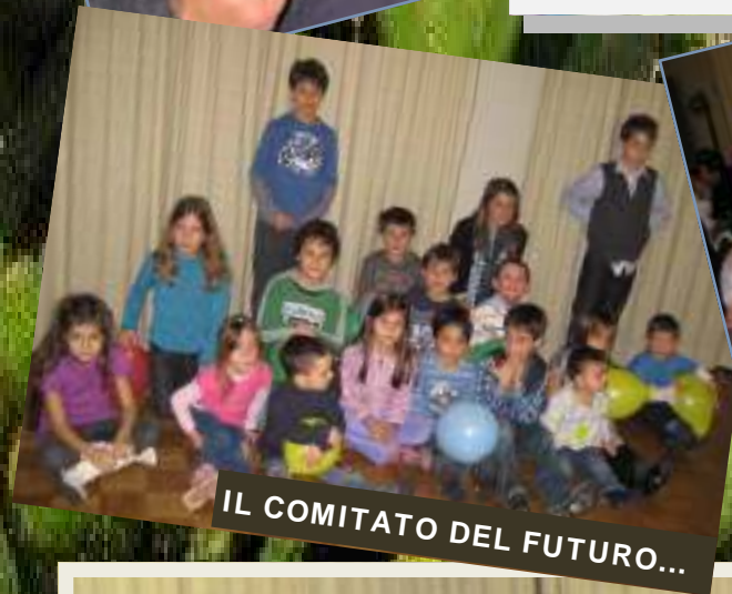
IL COMITATO DEL FUTURO...