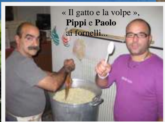
« Il gatto e la volpe », Pippi e Paolo ai fornelli...