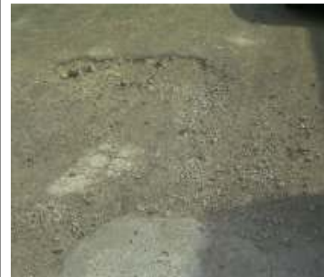
Via Ugo Foscolo, Barbarano