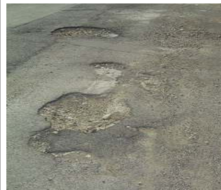
Via Galileo Galilei (Cimitero), Barbarano